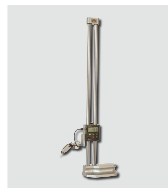
DIGIMATIC Höjdritsmått i tvåpelarutförande