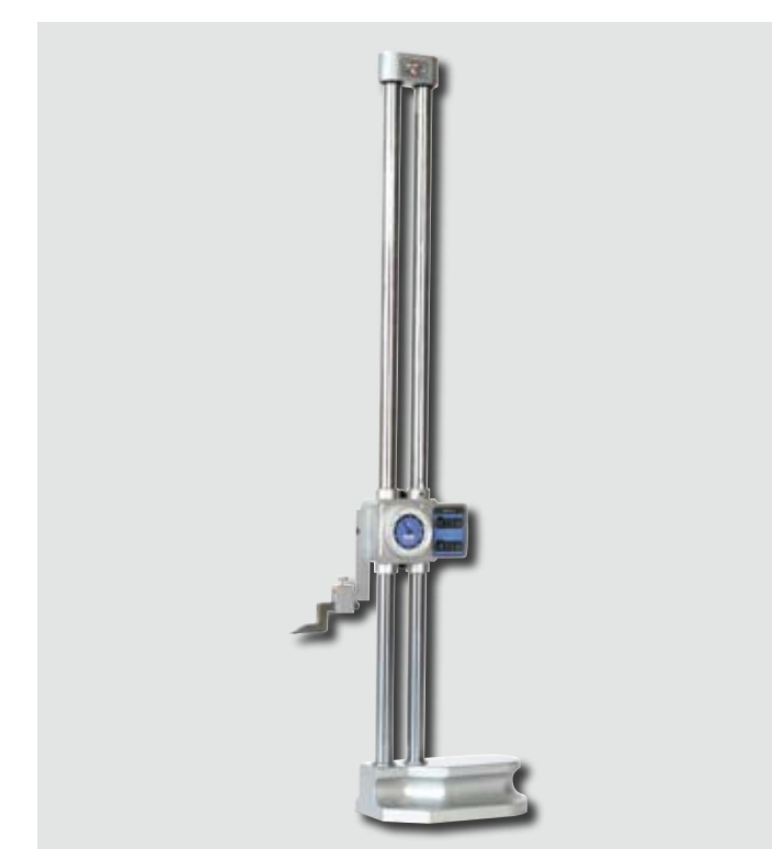
Höjdritsmått med räkneverk och mätur

Höjdmät- och ritsinstrument används för mätning av höjden från en referensyta och/eller ritsning av ett arbetsstycke på önskad höjd från referensytan. Vanligtvis används planskivan som foten står på som referensyta.