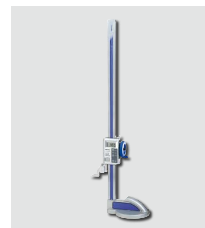
ABSOLUTE DIGIMATIC Höjdritsmått