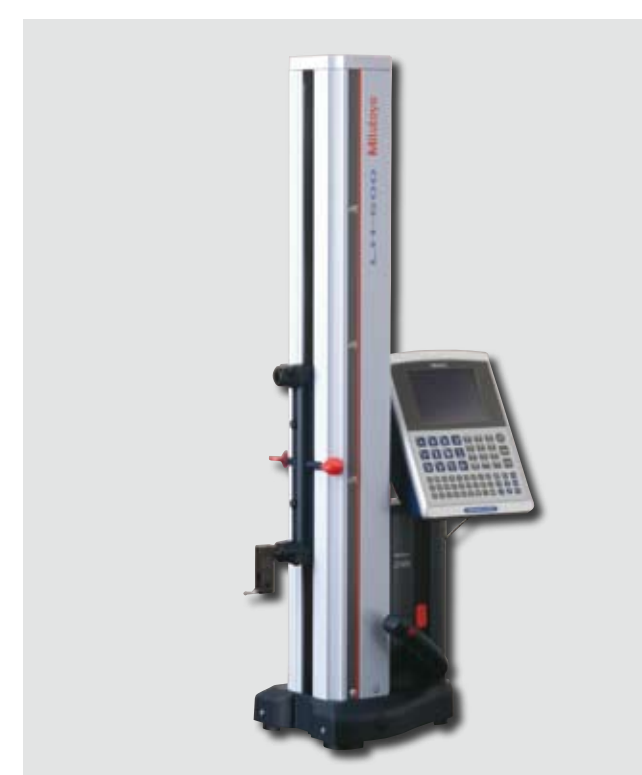
Linjär höjdmätare med 2D-dataprocessor