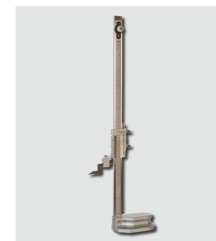
Precisionshöjdritsmått med nonie