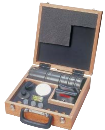
Levereras med etui