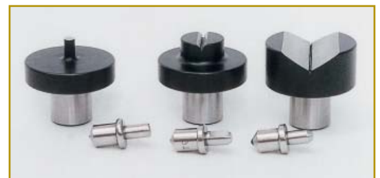
Indentrar och bord